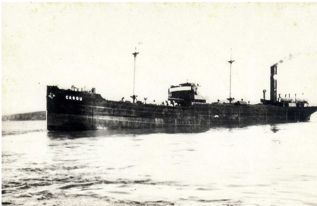
Le Cagou