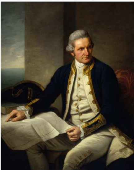
James Cook – National maritime Museum Greenwich