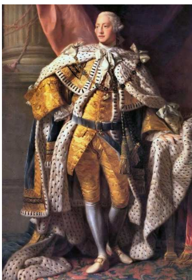
George III – National Portrait Gallery Londres

Sur le revers de la médaille, on peut lire : “RESOLUTION ADVENTURE Sailed from England March MDCCLXXII” (1772).